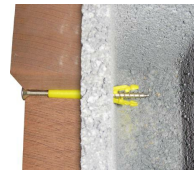
cheville traversante - vue en coupe dans le parpaing