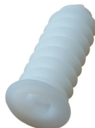
Cheville polystyrène Ø34 x 90