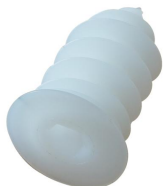
Cheville polystyrène Ø34 x 60