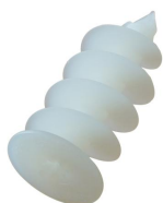
Cheville polystyrène Ø25 x 57