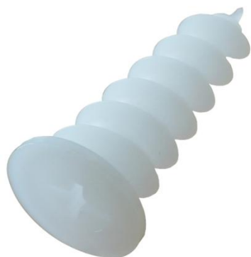
Cheville polystyrène Ø23 x 50