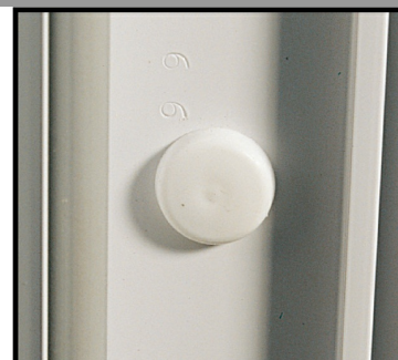
4. Mettre en place le capuchon orientable c'est fini !