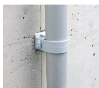
FIX-RING+ - vue en situation